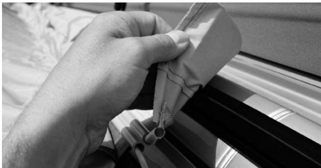
4. Sonderausstattung / special equipment: Magnetadapter / magnetic adaptor