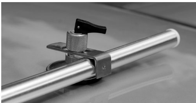
5. Sonderausstattung / special equipment: mit Klappsauger und Klemmstange/ with sucker and connection pole