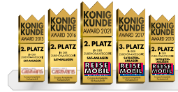
Zahlreiche Auszeichnungen krönen die Qualität unserer Megasat-Produkte