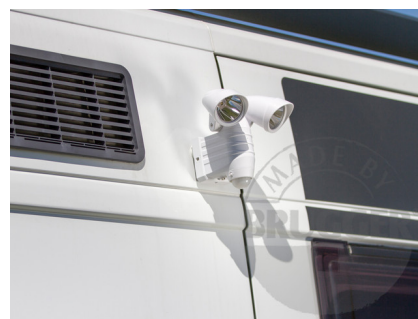
Lampen magnetisch am Kastenwagen befestigt