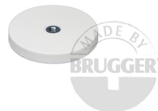
Magnetsysteme mit weißem Gummimantel