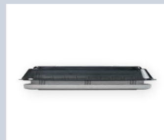
QUIPON SKY, ART. NR. 9955468 (ABB. LINKE SEITE)