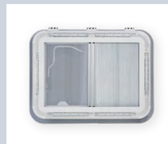
QUIPON SKY, ART. NR. 9955468 (ABB. RECHTE SEITE)